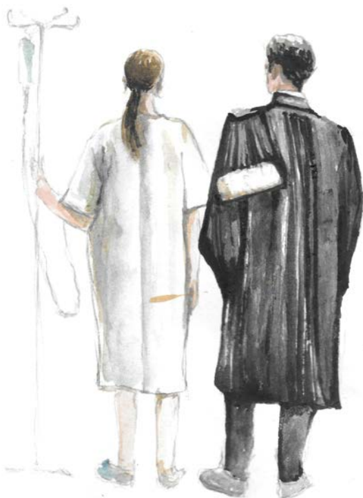
Illustration : Juliette Villars

sous la direction du Professeur Bruno Py